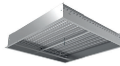
R-ADQ Klapka s protiběžnými listy pro jednoduchou regulaci proudění vzduchu.